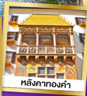
หลังคาทองคำ