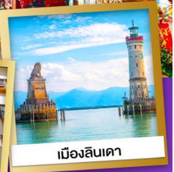
เมืองลินเดา