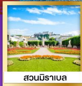
สวนมิราเบล