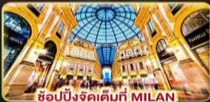
ช้อปปิ้งจัดเต็มที่ MILAN

ดินแดนแห่งธรรมชาติ กับเวลาที่ให้ท่านได้พักผ่อนอย่างเต็มที่