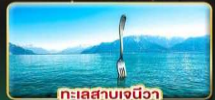
ทะเลสาบเจนีวา