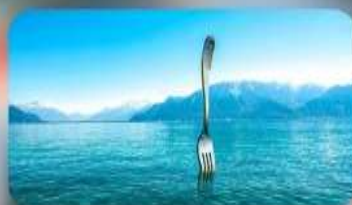
ทะเลสาบเจนีวา