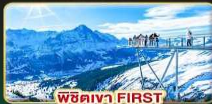
พีชิตเขา FIRST