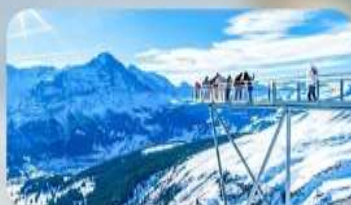
พีชิตเขา FIRST