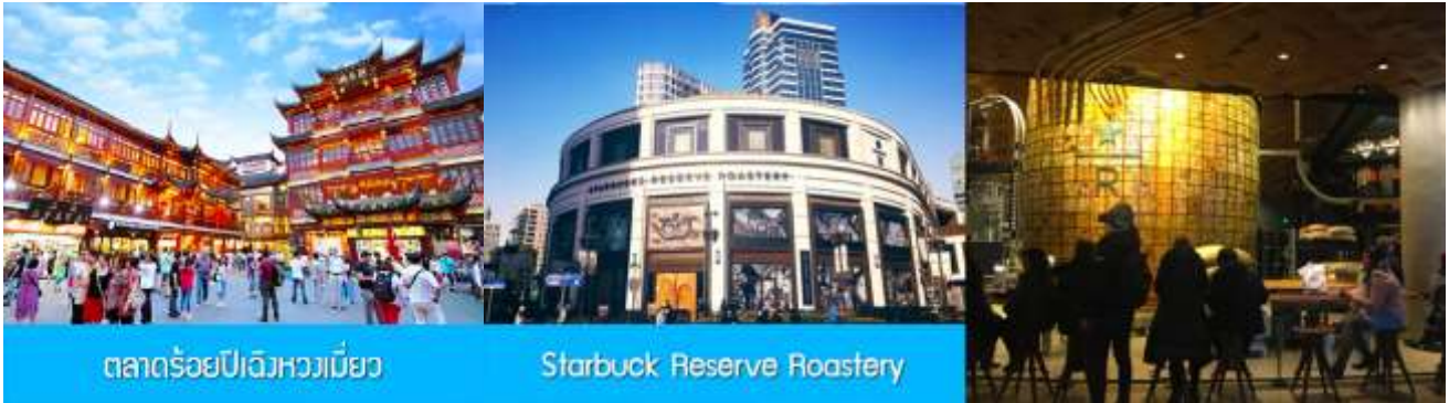
ตลาดร้อยปีเฉิงเหมียว

พักที่ โรงแรม Holiday Inn Express Hotel 4* หรือเทียบเท่าในนครเชียงใหม่