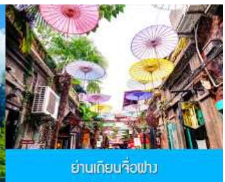
ย่านเฉิงเหมียว