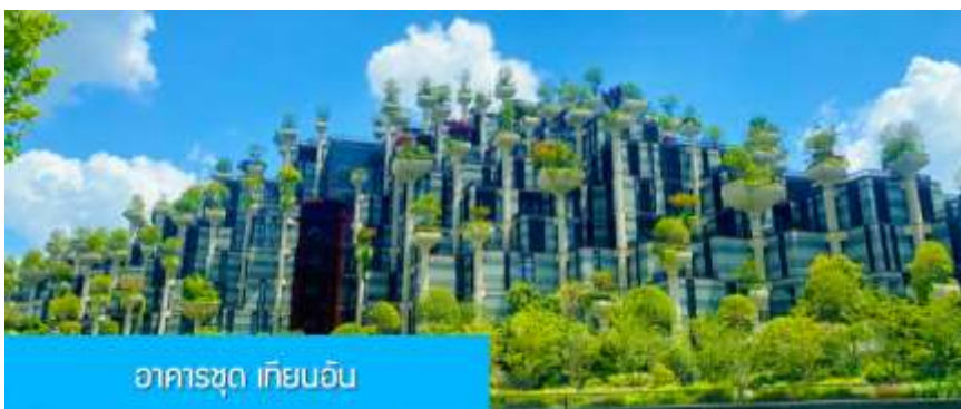
อาคารชุด เทียนอัน