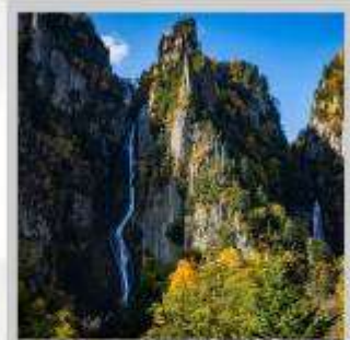
“GINGA & RYUSEI FALLS”

สัมผัสความสวยงามของดอกไม้ “ดอกทิวลิป ณ สวนคะมิยูเบตสึ” ที่มีมากกว่า 120 สายพันธุ์ เพลิดเพลินกับ “ถ้ำน้ำแข็งไอซ์ พาวีเลียน” ที่มีหยดน้ำแข็งรูปร่างสวยงามต่างๆ ที่อุณหภูมิ -20 องศา “ฟาร์มสุนัขจิ้งจอกฮอกไกโด” ฟาร์มสุนัขจิ้งจอกแห่งเดียวของเกาะฮอกไกโด สายพันธุ์ท้องถิ่นคือ สายพันธุ์ Ezo red fox ชมกระท่อมไม้หลังน้อยในดินแดนเทพนิยาย ณ “หมู่บ้านนิงเกิลเทอร์เรซ” จำหน่ายสินค้าจำพวกงานฝีมือต่างๆ นำท่านขึ้นชมวิวมุมสูง “นั่งกระเช้าภูเขาไฟโมอิวะ” เพื่อชมทัศนียภาพของเมืองซัปโปโรจากมุมสูง ชม “ทุ่งดอกพืชมอส ณ สวนทาคิโนะอุเอะ” ด้วยพรมสีเขียวที่มีพื้นที่ขนาดใหญ่ถึง 100,000 ตารางเมตร