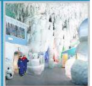
"KAMIKAWA ICE PAVILLION"