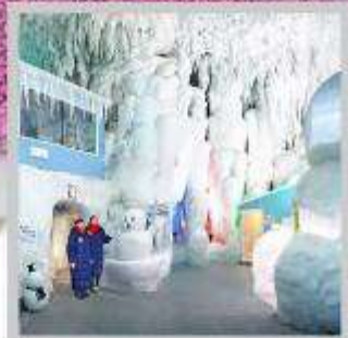
“KAMIKAWA ICE PAVILLION”