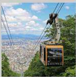
“MT. MOIWA ROPEWAY”