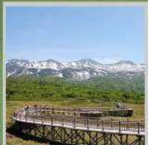
"SHIRETOKO 5 LAKES"