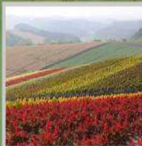
"SHIKISAI NO OKA"