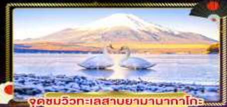
จุดชมวิวกะแลसानยามานากาโกะ