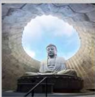
"HILL OF BUDDHA"