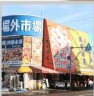
"JOGAI FISH MARKET"