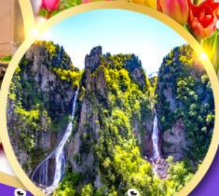
น้ำตกกิ่งกะ-น้ำตกริวเซ