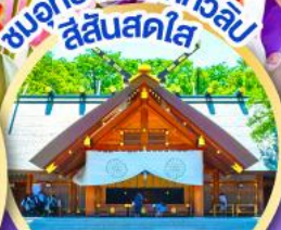
ชมอุทยานดอกทิวลิป สีแสนสดใส