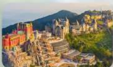
เที่ยวบานาฮิลล์เต็มวัน

TTC HOI AN HOTEL หรือเทียบเท่ามาตรฐานเวียดนาม