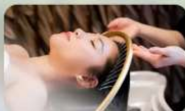
สระผสมสโตร์เวียดนาม