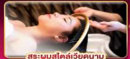
สระผมสไตล์เวียดนาม