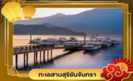
ทะเลสาบสุริยอินจันตรา