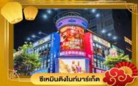
ช้อปปิ้งไนท์มาร์เก็ต