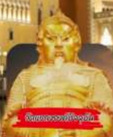
วัดของงก