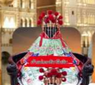
วัดของงก