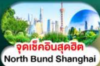
จุดเช็คอินสุดฮิต North Bund Shanghai

เซี่ยงไฮ้ หางโจว ล่องทะเลสาบซีหู ฟรีเดย์