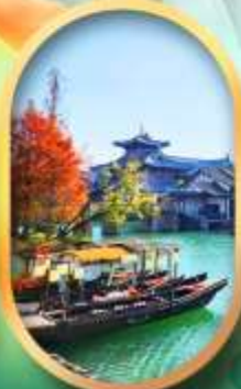
เมืองโบราณผู้หยวน