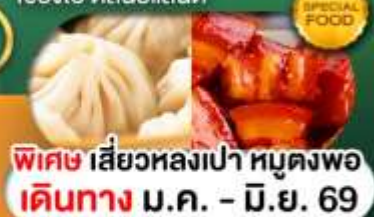
พิเศษ เสี่ยวหลงเป่า หมูแดงพอ เดินทาง ม.ค. - มิ.ย. 69