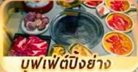
บุฟเฟ่ต์ปิ้งย่าง