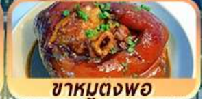
ชาหมูตงพอ