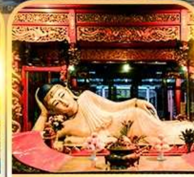
วัดพระหยกขาว