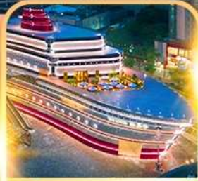
เรือ The LOUIS