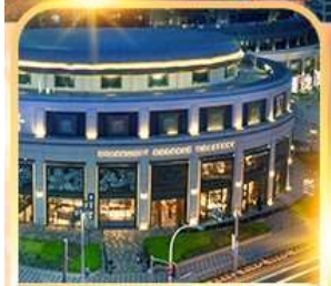
Starbucks Reserve Roastery