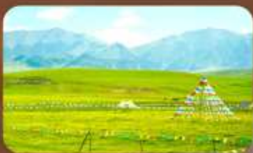
ทุ่งหญ้าออร์คอส