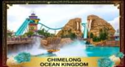
CHIMELONG OCEAN KINGDOM