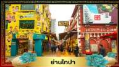
ย่านโกปา