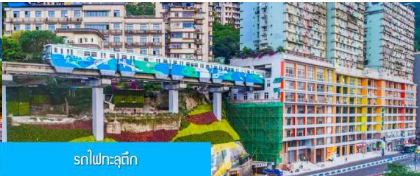
รถไฟฟ้าชุนตึก