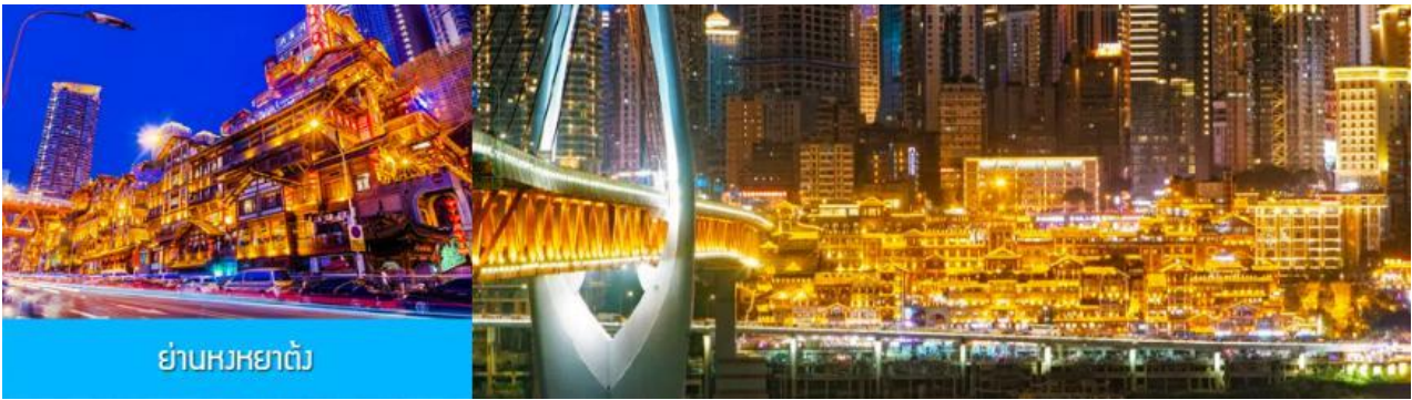
ย่านหงหยาดัง