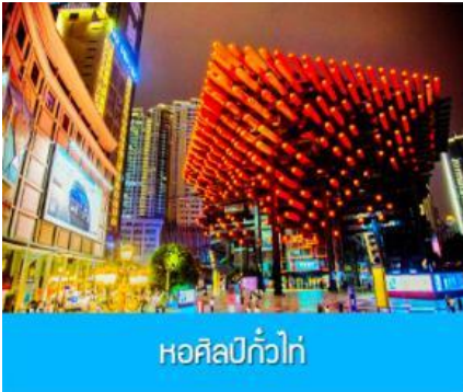
หอศิลป์กั๋วไท่

รับประทานอาหารกลางวัน ณ ร้านอาหารพื้นเมือง (8)