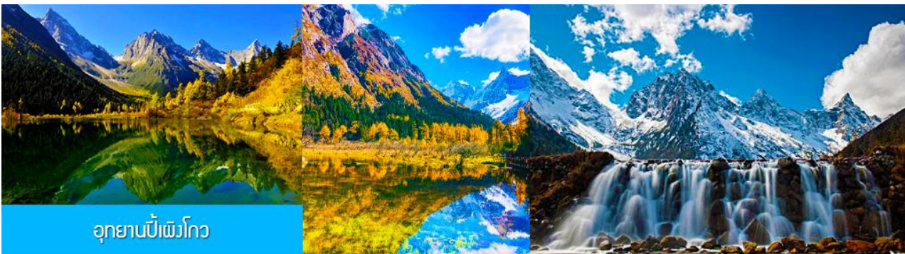
อุทยานปีเพิงโกว