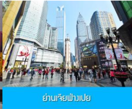
ย่านเจียฟางเปย