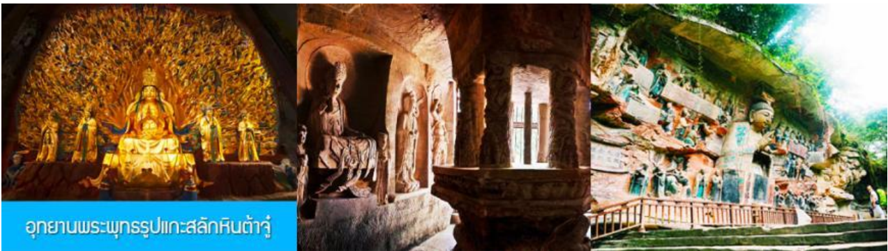
อุทยานพระพุทธรูปแกะสลักหินต้าจู่