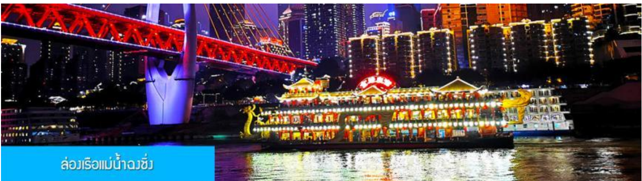
ล่องเรือแม่น้ำจิ่ง

รับประทานอาหารค่ำ ณ ภัตตาคาร (6) (เมนูสุกี้หม่าล่าต้นตำหรับจงชิ่ง)