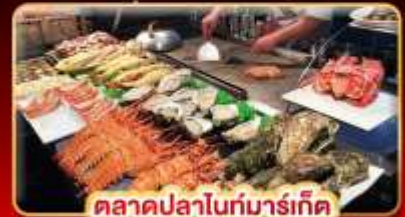
ตลาดปลาไนท์มาร์เก็ต