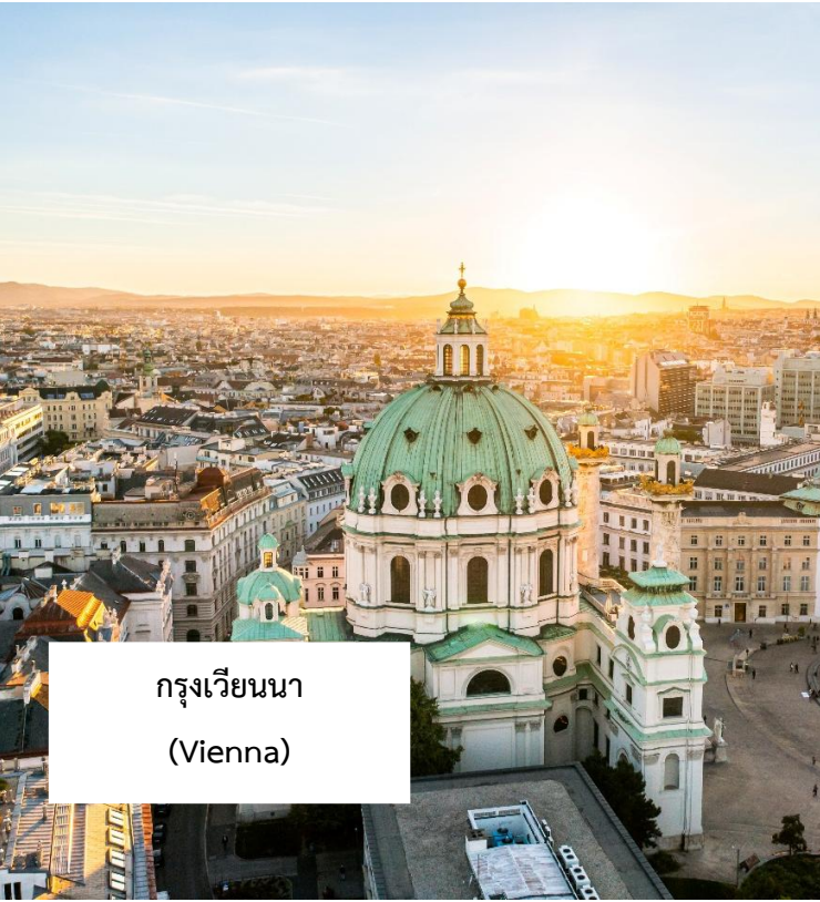
กรุงเวียนนา (Vienna)

เมนูพิเศษ!!! กลูชาซูป อาหารประจำชาติฮังการี