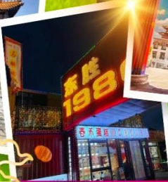
ถนนคนเดินคังบาศ์ซี