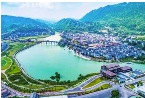
เมืองโบราณจั่วซู่ย

เที่ยง รับประทานอาหารกลางวัน ณ ภัตตาคาร (5)