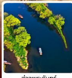
อ่าวพระจันทร์

• ไอลาร์ เช็คอิน ลั่วซิงตุน หอคอยดาวตกแห่งเจียงซี คุบเขาวังเซียนกู่ ดินแดนสวยดุจเทพนิยาย