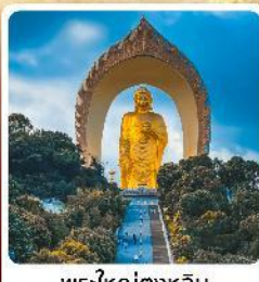
พระใหญ่ตงหลิน