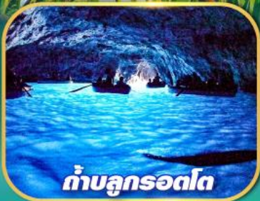
ถ้ำบลูกรอดโก