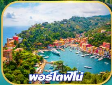
พอร์ตอฟีโน