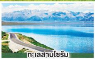
ทะเลสาบไซรัม