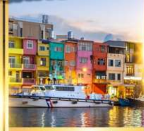
ท่าเรือประมงเจิ้งปิง