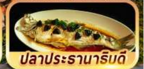
ปลาประรานาริดดี