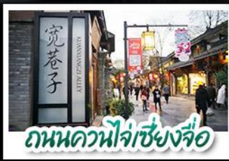
ถนนควนไห่เซียงจื่อ