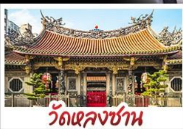
วัดเจหลงชาน