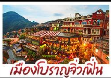
เมืองโบราณจิ่วเฟิ่น

เที่ยวธรรมชาติระดับโลก เอเชีย ทะเลสาบสุริยันจันทรา - เมืองดงครบ ไทเป จิ่วเฟิ่น - ซีเหมินติง