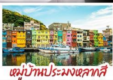
หมู่บ้านประมงเหลากสี