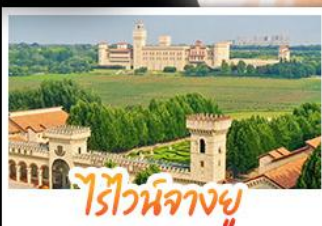
ไรไวน์ฟางยู