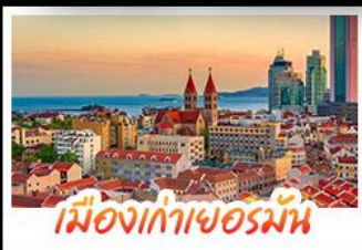
เมืองเก่าเยอรมัน

เมืองเก่าชิงเต่า - สลับกับเมืองโบราณหมิงสุ่ย เมืองเก่าเยอรมัน - ไรไวน์ฟางยู - สวนสตรอว์เบอร์รี่