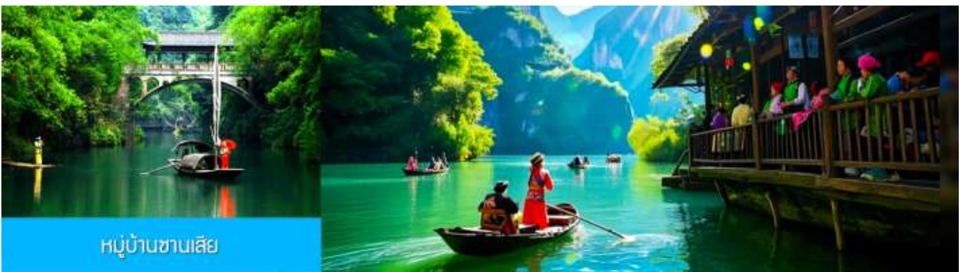
หมู่บ้านชาวนเลีย

พักที่ YICHANG HUIHAO HOTEL โรงแรมระดับ 4 ดาวหรือเทียบเท่าในเมืองหยี่ชาง