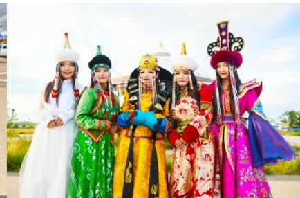
แต่งชุดพื้นเมืองบอโกล