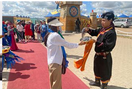
พิธีต้อนรับแขกด้วยเหล้า