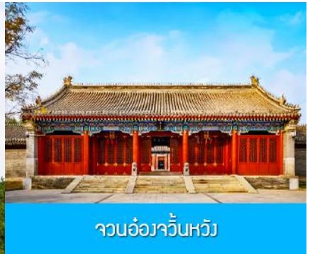
จวนอ๋องจวินหวัง

วันที่หก เมืองเออร์ดอส -อี้ค้อเอ้าเปา-พิพิธภัณฑ์เครื่องเงิน-จวนอ๋องจวินหวัง- สวนวัฒนธรรมหมงกู่หยวน หลิว-ซื้อปิ้งถนคนเดิน