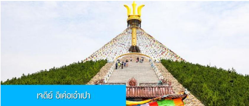
เจดีย์ อี้ค้อเอ้าเปา

พักที่ DALAEQI SHNAGJING HOTEL โรงแรมระดับ 4 ดาวหรือเทียบเท่าในเมืองต้าลาเท่อ