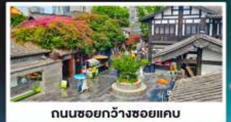
ถนนชอยกวางชอยแคว