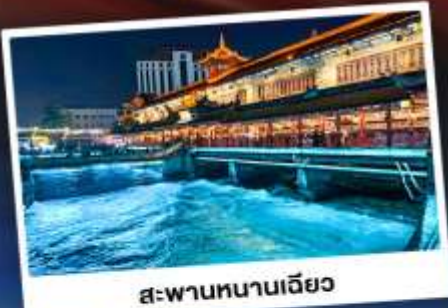
สะพานหนานเฉียว