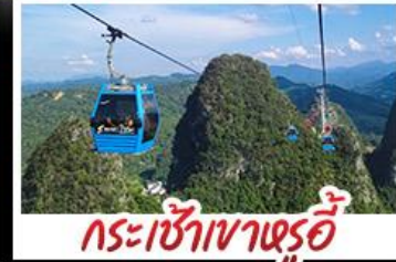
กระเช้าเวาหลูอี้