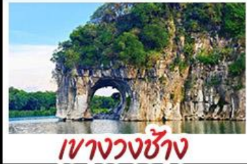
เวางวงซ้าง