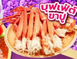
บุฟเฟ่ต์ ขาปู