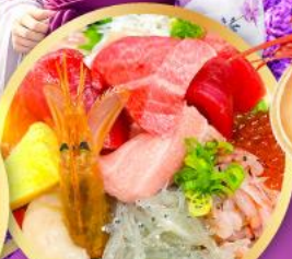
ตลาดปลาชิบิสึ คาชิโนะอิชิ