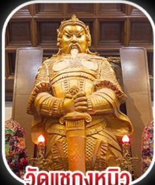
วัดเขกหงหมีว

สวนสนุก CHIMELONG SPACESHIP PARK เจ้าแม่กวนอิมร์พลีสเบย์ - เจ้าแม่กวนอิมฮ่องฮำ วัดเขกหงหมีว - พระใหญ่ของปิง+กระเช้า เมนูสุดพิเศษ!! เป้าอ้อ+ไวน์แดง , ห่านย่าง