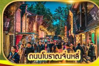
ถนนโบราณจิ้นหลี่