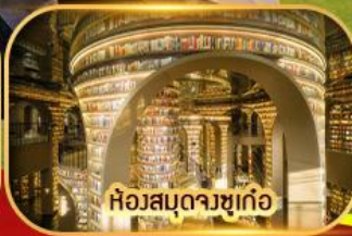
ห้องสมุดจางซูเกอ