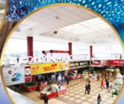
ตลาดกึ่งเปีย