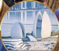
โรงแรมหรูไฮ้มุก