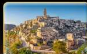
ตามรอย 007 เมือง Matera