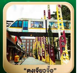
“ดงเจียวจื่อ”