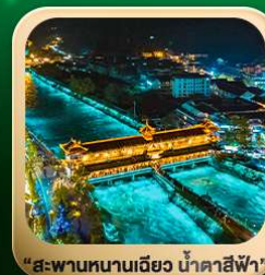
“สะพานหนานเฉียว น้ำคาสีฟ้า”