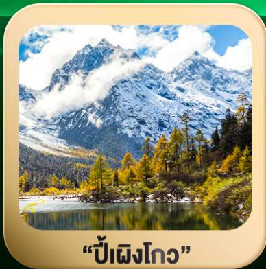
“ปี่ผิงโกว”

ชมธรรมชาติ 2 อุทยานขึ้นชื่อ อุทยานภูเขาสี่ครุณี + อุทยานปี่ผิงโกว สะพานหนานเฉียว • ถนนคนเดินไท่กู่หลี่ + ซุนซีลู่ + Pop Mart • ดงเจียวจื่อ