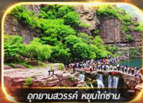
อุทยานสวรรค์ หยุนโก่ซาน