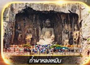
ถ้ำพาลงเหมิน