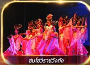
ชมโชว์ราชวงศ์ถัง

นั่งรถไฟความเร็วสูง ย้อนประวัติศาสตร์อันยิ่งใหญ่ "กองทัพทหารจีนซี" สัมผัสความงามอุทยานสวรรค์ พิเศษ!! ชมโชว์ราชวงศ์ถัง เก็บครบทุกไฮไลต์ ซอปปิงจิว ห้าง WU YUE