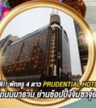
การันตี!! พักหรู 4 ดาว PRUDENTIAL HOTEL ศิริกิตติบนนาธาน ย่านช้อปปิ้งจิมซาจอย