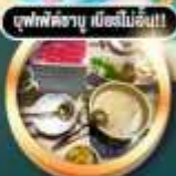
บุฟเฟ่ต์อายุ 6 เดือนขึ้นไป!!