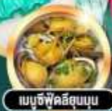
เมนูซีฟู๊ดสุดหรู