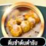
ส้มซ่าดับคำรับ