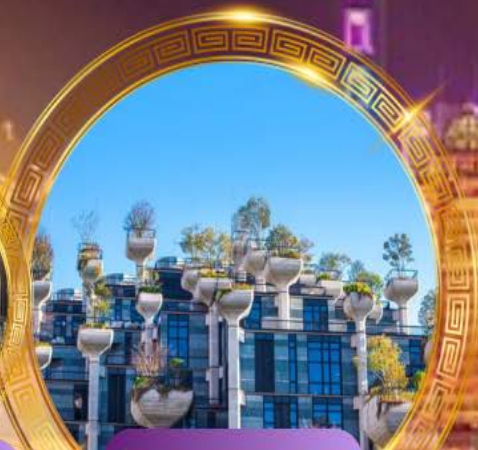
Tian An 1,000 Trees