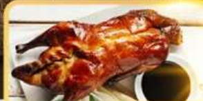
เปิด Four Season