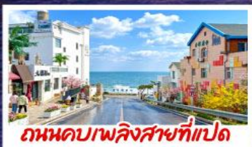
ถนนคาสปิออสที่แปด