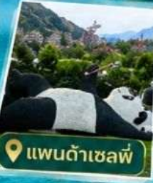
📍 แพนด้าเซลฟ์