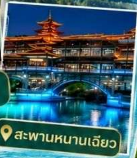
📍 สะพานหนานเฉียว