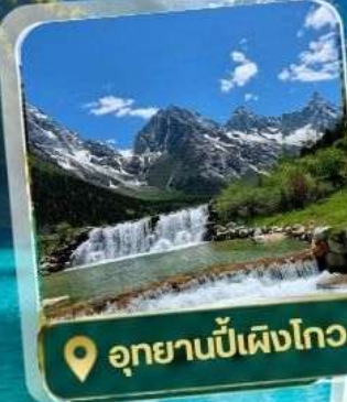
📍 อุทยานปีเพิงโกว

📍 เดินทาง ✈️ 17 - 21 กรกฎาคม 69 24-28 กรกฎาคม 69 28 ก.ค. - 01 ส.ค. 69