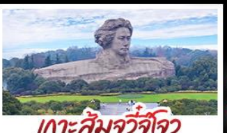
เกาะกั่มจิวจิว