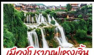
เมืองโบราณฝูเจียง