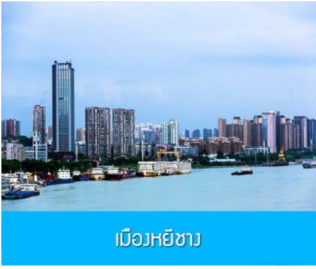
เมืองหยีซาง