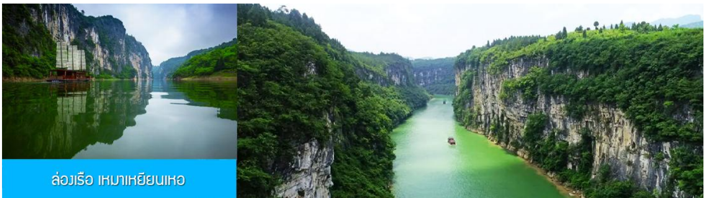
ล่องเรือ เหมาเหยียนเหอ