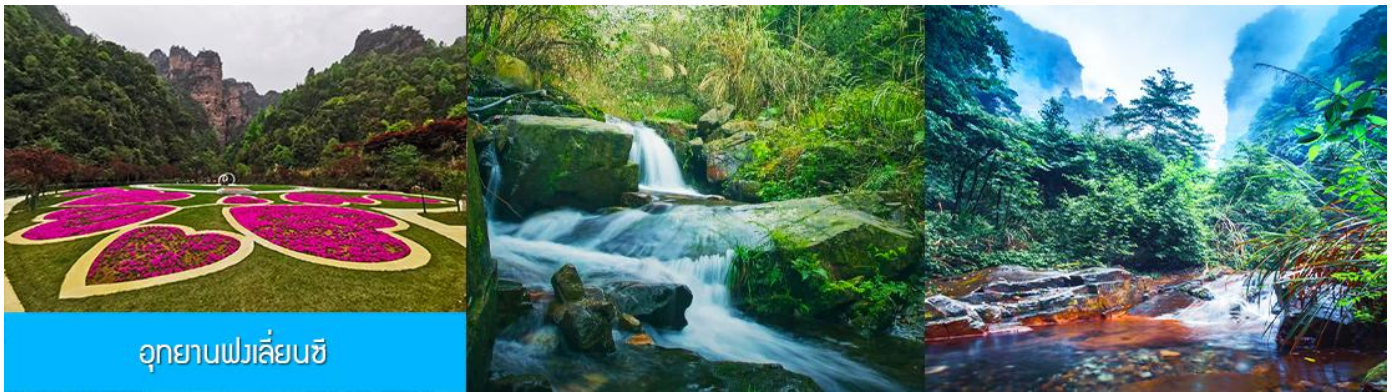
อุทยานฟงเลียนซี