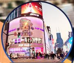
ถนนหนานจิง