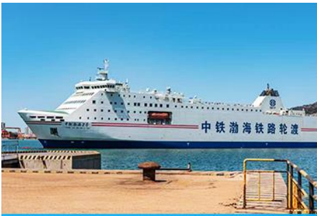
เรือ ZHONGTIE BOHAI CRUISE