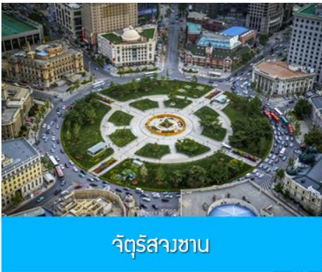
จัตุรัสวงเวียน