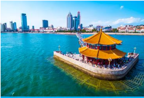
สะพานเทียนเอียว