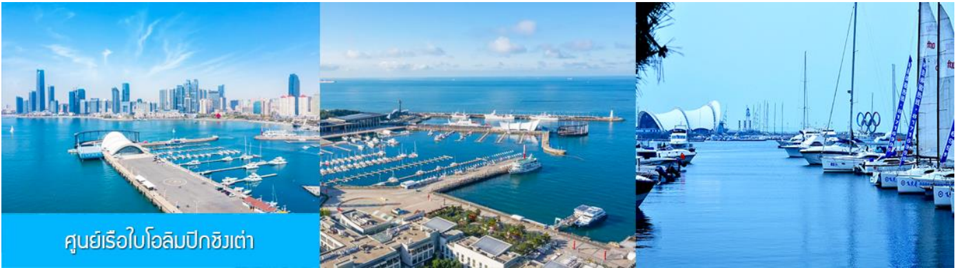
ศูนย์เรือใบโอลิมปิกชิงเต่า

จากนั้นนำท่านเที่ยวชม โรงเบียร์ชิงเต่า 青岛啤酒博物馆 พิพิธภัณฑ์เบียร์ที่ขึ้นชื่อของเมืองชิงเต่า ซึ่งเป็นเบียร์ยี่ห้อแรกที่ผลิตขึ้นในประเทศจีน ชมเบียร์ คอลเลกชันที่มียี่ห้อหลากหลายที่สุดของโลก และชมการจัดแสดงภาพและวิดิทัศน์เกี่ยวกับวิวัฒนาการของเบียร์ ขั้นตอนการผลิตและอื่น ๆ ที่เกี่ยวข้อง พร้อมชิมเบียร์ชิงเต่า ซึ่งเป็นเบียร์ที่ขายดีที่สุดในยี่ห้อหนึ่งของจีน.. (ชิมเบียร์ชิงเต่าท่านละ 1 แก้ว รับกลับอีก 1 ขวดเล็ก ตอนเดินออก)