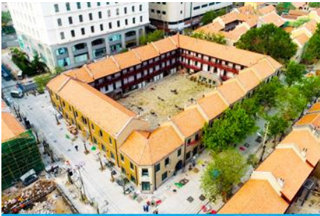
เมืองเก่าเยอรมัน ตรอกกว้างชิงหลี

จากนั้นนำท่านเดินเที่ยวชม ถนนจงซวน 中山路 ถนนที่เต็มไปด้วยกลิ่นอายยุโรป และถนนสายนี้มีบันทึกรื่องราวมากกว่าศตวรรษของเมืองชิงเต่าไว้ ที่นี่เป็นศูนย์กลางการค้าแห่งแรกที่เต็มไปด้วยสถาปัตยกรรมสไตล์ยุโรปเก่าแก่ที่ได้รับอิทธิพลมาจากเยอรมัน ให้ท่านได้เดินเก็บบรรยากาศ และ เก็บภาพกับ โบสถ์เซนต์ไมเคิล (ด้านนอก) โบสถ์แห่งนี้ที่คู่รักนิยมมาถ่ายภาพงานแต่งงานกันมากที่สุดในเมืองชิงเต่า ให้ท่านถ่ายรูปเก็บภาพ