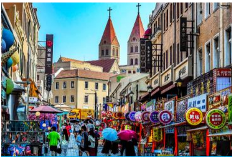
ถนนวงซวน

หลังอาหารนำท่านเดินทางชม สะพานจ้านเถียว 栈桥 เป็นแลนด์มาร์กแห่งประวัติศาสตร์คู่เมืองชิงเต่า สร้างเมื่อปี ค.ศ.1891 มีลักษณะเป็นสะพานหินทอดยาวกว่า 440 เมตรสู่ทะเล ปลายสะพานมีศาลา ทรงแปดเหลี่ยมสีแดงที่โดดเด่น ซึ่งเป็นสัญลักษณ์บนฉลากเบียร์ชิงเต่า ขึ้นชื่อเรื่องวิวสวย รับลมทะเล ให้ท่านเก็บภาพบรรยากาศ