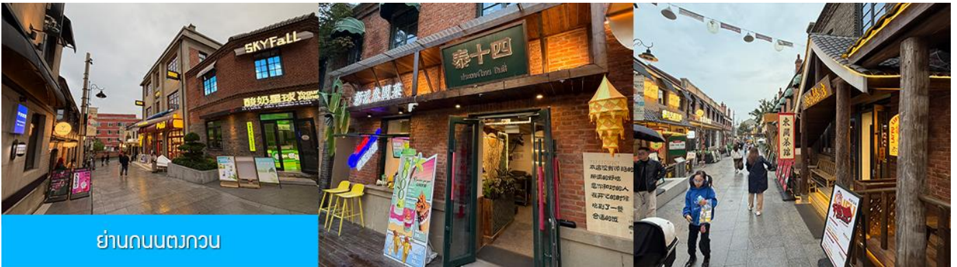
ย่านถนนตงกวน

นำท่านเที่ยวชม จัตุรัสชิงไห่ 星海广场 เป็นจัตุรัสขนาดใหญ่เป็นแลนด์มาร์คสำคัญของเมืองต้าเหลียน สร้างขึ้นเพื่อเฉลิมฉลองในโอกาสที่รัฐบาลอังกฤษคืนเกาะฮ่องกงในให้จีนในปี ค.ศ. 1997 ตั้งอยู่ชายฝั่งทะเลในเมืองต้าเหลียน เป็นจัตุรัสใจกลางเมืองที่ใหญ่ที่สุดในโลกและเป็นแลนด์มาร์คของเมืองต้าเหลียน รายล้อมด้วยตึกระฟ้าที่ทันสมัย ภายในมีบ่อน้ำพุดนตรี ลานหญ้าขนาดใหญ่ และลานกว้างสำหรับจัดกิจกรรมกลางแจ้ง อาทิ เทศกาลเปียร์นานาชาติ การแข่งขันวิ่งมาราธอน งานแฟชั่นนานาชาติเมืองต้าเหลียน ฯลฯ