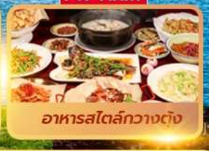
อาหารสไตล์กวางตุ้ง