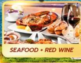
SEAFOOD + RED WINE