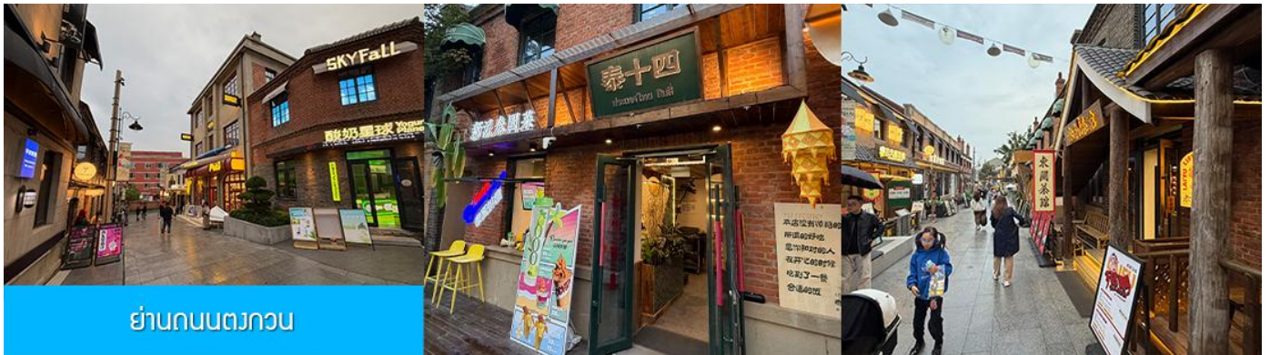
ย่านถนนตงกวน

นำท่านเที่ยวชม จัตุรัส星海 星海广场 เป็นจัตุรัสขนาดใหญ่เป็นแลนด์มาร์คสำคัญของเมืองต้าเหลียน สร้างขึ้นเพื่อเฉลิมฉลองในโอกาสที่รัฐบาลอังกฤษคืนเกาะฮ่องกงในให้จีนในปี ค.ศ. 1997 ตั้งอยู่ชายฝั่งทะเลในเมืองต้าเหลียน เป็นจัตุรัสใจกลางเมืองที่ใหญ่ที่สุดในโลกและเป็นแลนด์มาร์คของเมืองต้าเหลียน รายล้อมด้วยตึกระฟ้าที่ทันสมัย ภายในมีบ่อน้ำพุดนตรี ลานหญ้าขนาดใหญ่ และลานกว้างสำหรับจัดกิจกรรมกลางแจ้ง อาทิ เทศกาลเบียร์นานาชาติ การแข่งขันวิ่งมาราธอน งานแฟชั่นนานาชาติเมืองต้าเหลียน ฯลฯ