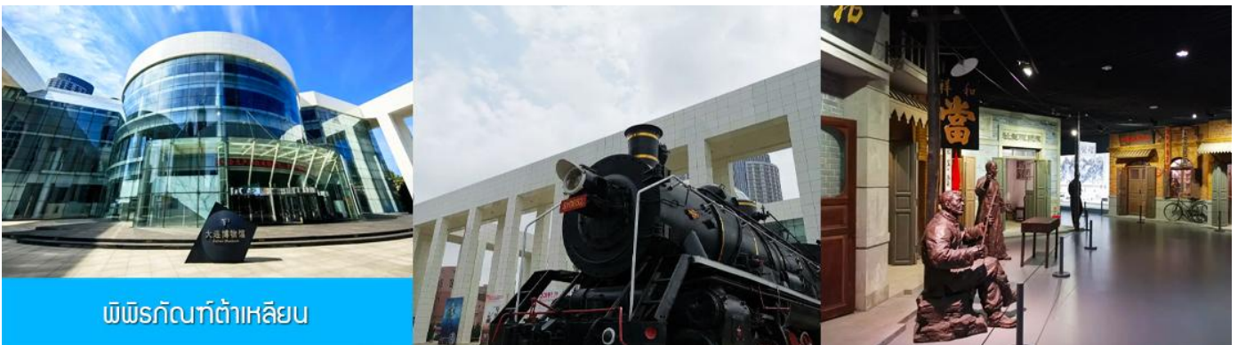
พิพิธภัณฑ์ต้าเหลียน

เช้า รับประทานอาหารเช้า ณ ห้องอาหารของโรงแรม (13)