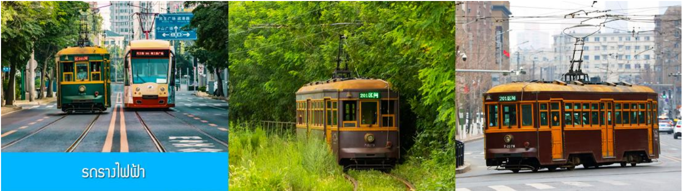
รถรางไฟฟ้า